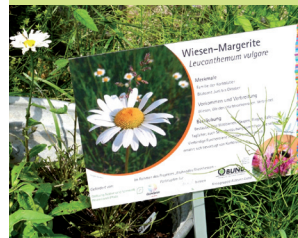
Informationen über Wildbienen und ihre Nahrungspflanzen

Im Rahmen des BUND-Projektes „Blühendes Rheinhessen – Farbtupfen für Wildbienen“ ** wurden die Grünen Klassenzimmer um vier Flächen in der Gesamtgröße von 10.200 qm erweitert. Um sie zu artenreichen und attraktiven Wiesen zu entwickeln, wurden sie grundsaniert und mit einer Heusaat aus regionalen Beständen behandelt.