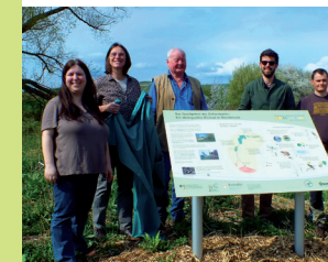
Ein Schild informiert über das Quellgebiet des Ochsenbachs

Im Rahmen des BUND-Projektes „Wasserläufer“ *** haben wir gemeinsam mit der AGENDA-BUND Mensch & Natur der VG Wörrstadt und Sulzheimer Bürger/innen zahlreiche Maßnahmen zu einer besseren Wasserrückhaltung im Gelände durchgeführt.