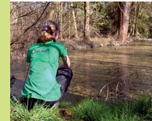
Lebensraum Teich und Tümpel

Eingebettet in landwirtschaftliche Nutzflächen existiert ein etwa 10 Hektar zusammenhängendes Mosaik aus Schilfflächen, Grünland, Bruchwäldern und Streuobstwiesen.