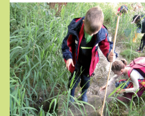
Kinder entdecken den Lebensraum Bach

Das Quellgebiet des Ochsenbaches im Michelstal bei Sulzheim ist eines der wenigen Feucht- und Sumpfbiootope in der Region und daher besonders schützenswert.