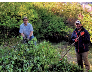
Landschafts- und Biotoppflege