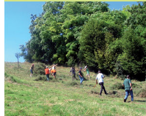
Landschafts- und Biotoppflege

Im Rahmen des BUND-Projektes „Blühendes Rheinhessen – Farbtupfen für Wildbienen“ ** wurden die Grünen Klassenzimmer um vier Flächen in der Gesamtgröße von 10.200 qm erweitert. Um sie zu artenreichen und attraktiven Wiesen zu entwickeln, wurden sie grundsaniert und mit einer Heusaat aus regionalen Beständen behandelt.