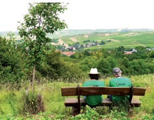
Natur erleben mit allen Sinnen

Aus landwirtschaftlichen Brachen entwickelten wir seit Mitte der 90er Jahre – ab 2001 auch in Zusammenarbeit mit der AGENDA-BUND Mensch & Natur der VG Wörrstadt – artenreiche Wiesen rund um Sulzheim, Schornsheim und Rommersheim.