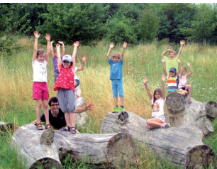
Naturerlebnis für Schulklassen und Kitagruppen

Für Schulklassen und Kindergartengruppen gibt es ein Naturerlebnisprogramm.