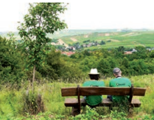
Natur erleben mit allen Sinnen

Aus landwirtschaftlichen Brachen entwickelten wir seit Mitte der 90er Jahre – ab 2001 auch in Zusammenarbeit mit der AGENDA-BUND Mensch & Natur der VG Wörrstadt – artenreiche Wiesen rund um Sulzheim, Schornsheim und Rommersheim.