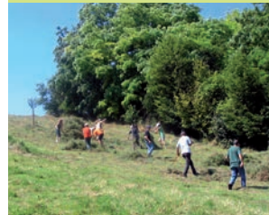
Landschafts- und Biotoppflege

Im Rahmen des BUND-Projektes „Blühendes Rheinhessen – Farbtupfen für Wildbienen“ ** wurden die Grünen Klassenzimmer um vier Flächen in der Gesamtgröße von 10.200 qm erweitert. Um sie zu artenreichen und attraktiven Wiesen zu entwickeln, wurden sie grundsaniert und mit einer Heusaat aus regionalen Beständen behandelt.