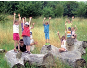
Naturerlebnis für Schulklassen und Kitagruppen

Für Schulklassen und Kindergartengruppen gibt es ein Naturerlebnisprogramm.