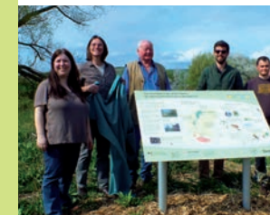
Ein Schild informiert über das Quellgebiet des Ochsenbachs

Zahlreiche und zum Teil in Rheinhessen sehr seltene Tiere und Pflanzenarten finden hier ihren Lebensraum.