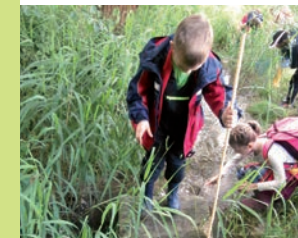
Kinder entdecken den Lebensraum Bach

Das Quellgebiet des Ochsenbaches im Michelstal bei Sulzheim ist eines der wenigen Feucht- und Sumpfgebiete in der Region und daher besonders schützenswert.