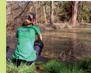
Lebensraum Teich und Tümpel

Eingebettet in landwirtschaftliche Nutzflächen existiert ein etwa 10 Hektar zusammenhängendes Mosaik aus Schilfflächen, Grünland, Bruchwäldern und Streuobstwiesen.