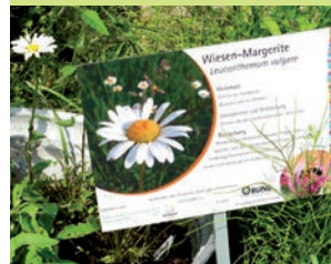
Informationen über Wildbienen und ihre Nahrungspflanzen

Im Rahmen des BUND-Projektes „Blühendes Rheinhessen – Farbtupfen für Wildbienen“ ** wurden die Grünen Klassenzimmer um vier Flächen in der Gesamtgröße von 10.200 qm erweitert. Um sie zu artenreichen und attraktiven Wiesen zu entwickeln, wurden sie grundsaniert und mit einer Heusaat aus regionalen Beständen behandelt.