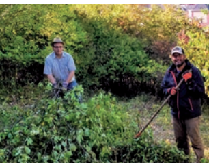
Landschafts- und Biotoppflege